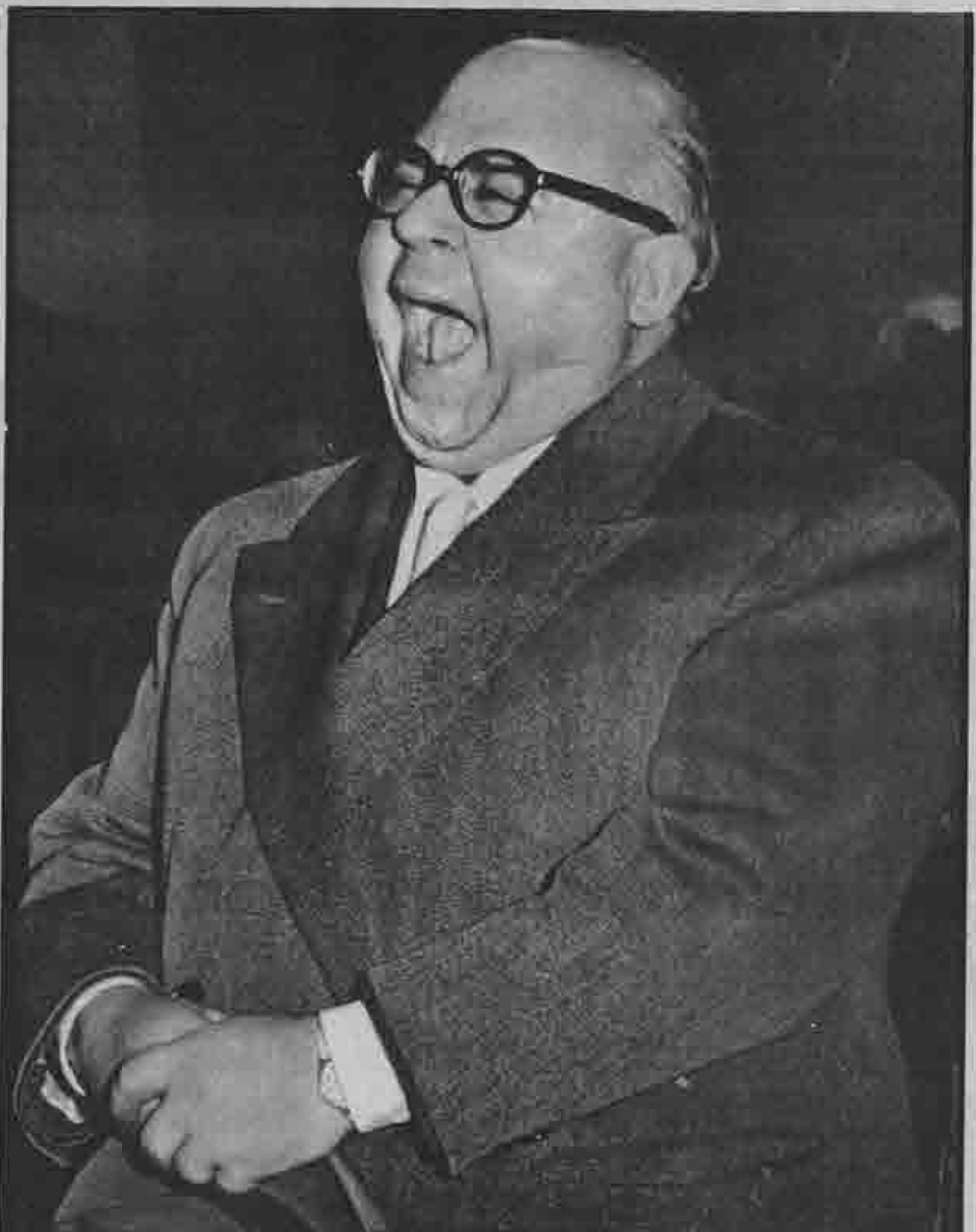
Il ministro dell'ingiustizia, Gonella. Ha smesso di annoiarsi.