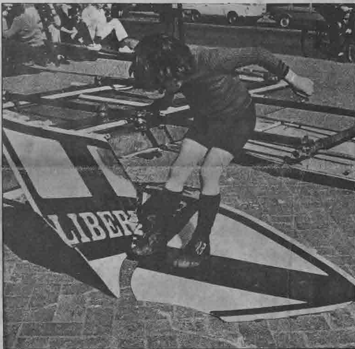
PISA - Il cartellone era enorme, luminoso, costoso. Diceva: «no agli opposti estremismi», «votate DC».

È stato il diretto proseguimento della lotta di venerdì e sabato quando le compagnie hanno rifiutato di andare a casa e hanno circondato il capo Ferrua chiedendo il pagamento immediato delle ore