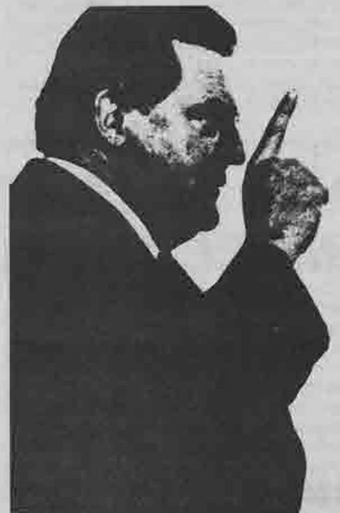
Franz Josef Strauss

Domenica 19 si vota nella Germania Federale. I cittadini sono chiamati a scegliere tra le due soluzioni corrispondenti alle maggiori tendenze del capitalismo contemporaneo: quella riformista, distensiva all'estero e repressiva all'interno, più autonomamente europea sul piano dell'azione imperialista, indirizzata verso forme corporativiste in rapporti di lavoro mediati dai sindacati (ed è la coalizione attualmente al governo dei socialdemocratici di Brandt e dei liberali di Scheel); e quella conservatrice, moderatamente ancorata agli schemi della guerra fredda, tiepidamente europeista perché rappresentante del capitale legato all'imperialismo americano, disposta allo scontro diretto con la classe operaia e quindi a forme repressive apertamente fasciste (la coalizione CDU-CSU di cristiano-sociali e di democristiani, con l'apporto di tutte le formazioni di estrema destra distrutte dalla legge elettorale che vieta l'ingresso al parlamento federale a chi raccolga meno del 5% dei voti).