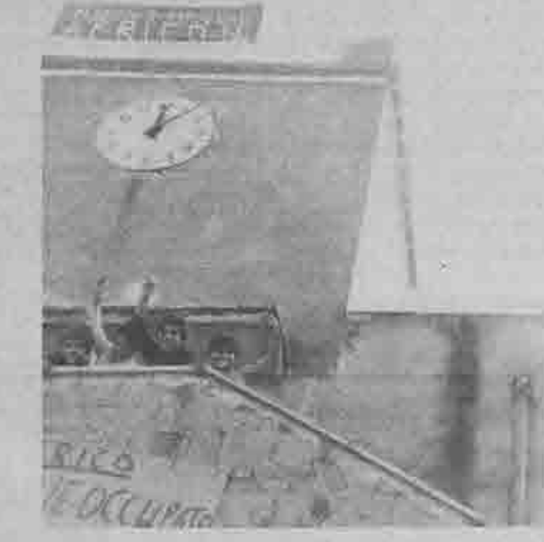
I RAGAZZI DI AFRICO NUOVO NEL COMUNE OCCUPATO